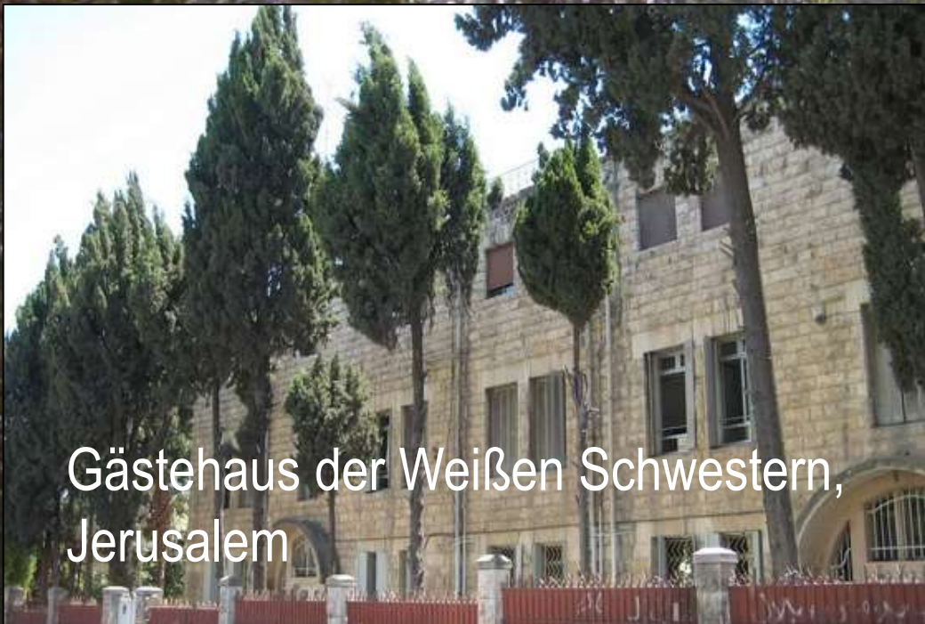
Gästehaus der Weißen Schwestern, Jerusalem