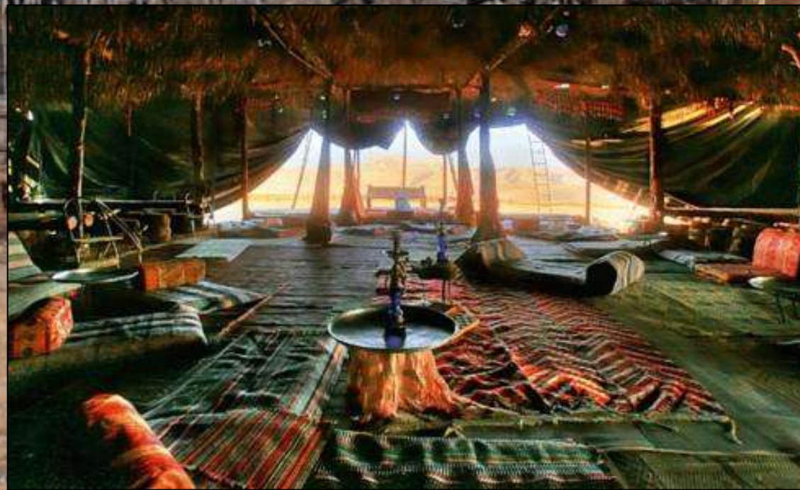
Kfar Hanokdim, Wüste Juda