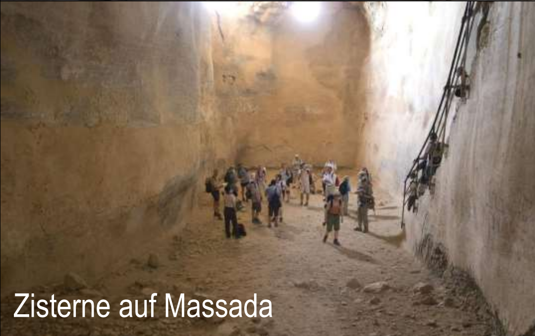
Zisterne auf Massada