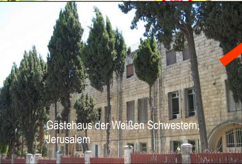
Gästehaus der Weißen Schwestern, Jerusalem