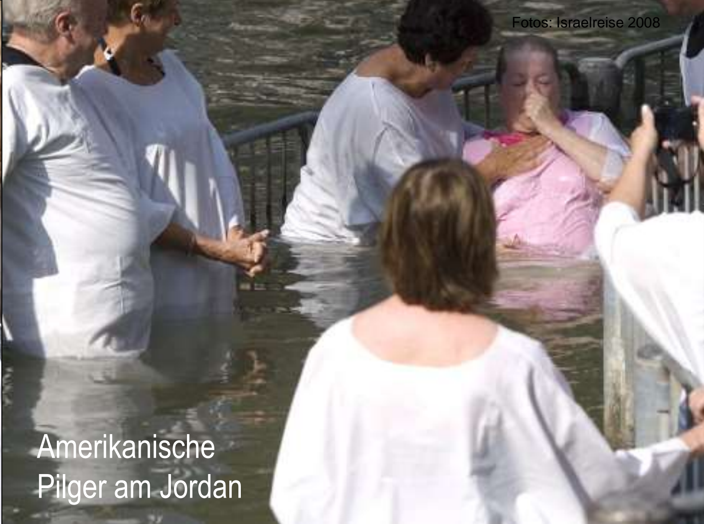
Amerikanische Pilger am Jordan