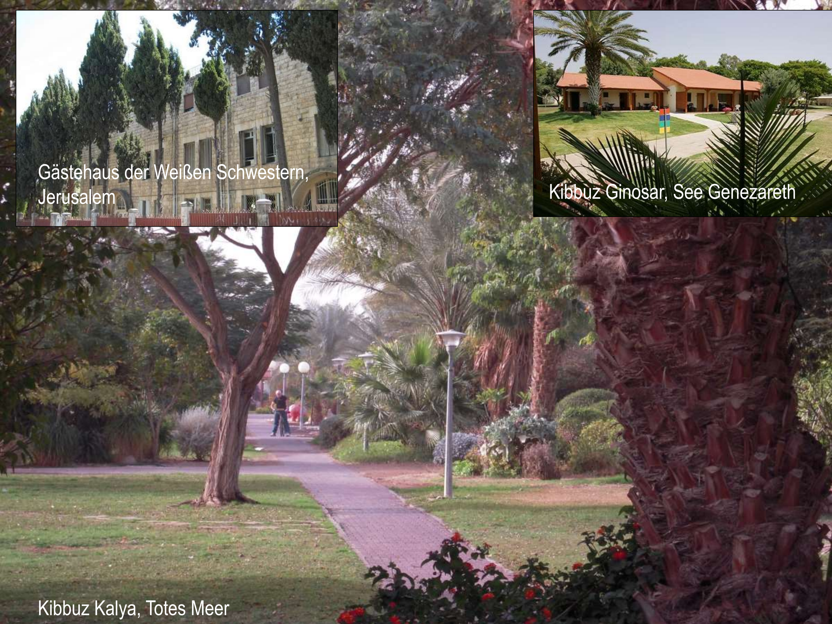
Kibbuz Kalya, Totes Meer