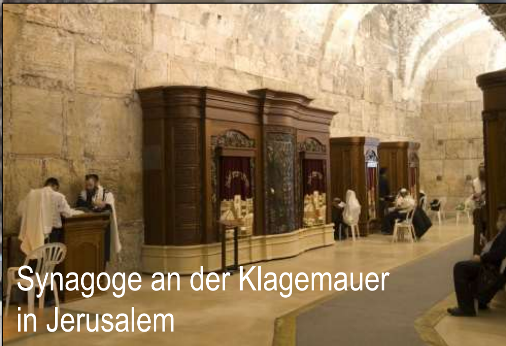
Synagoge an der Klagemauer in Jerusalem