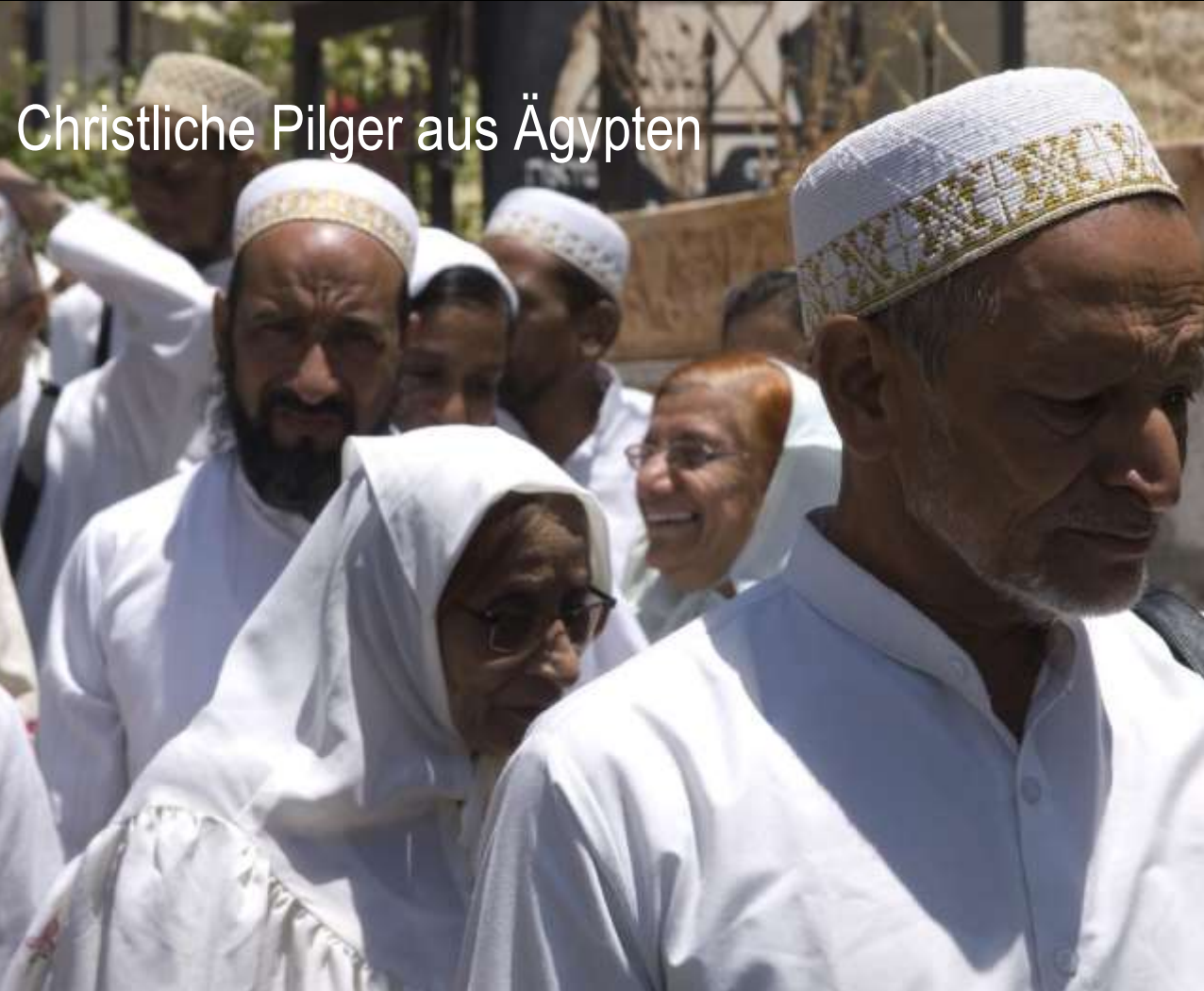
Christliche Pilger aus Ägypten