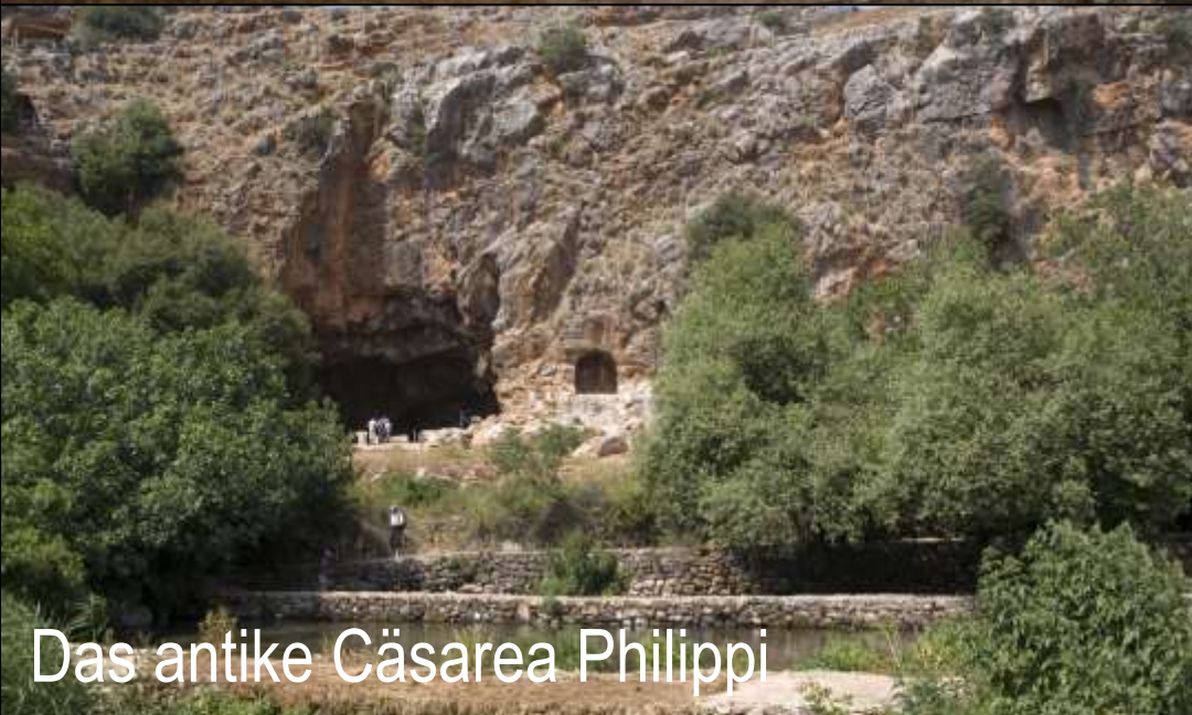
Das antike Cäsarea Philippi