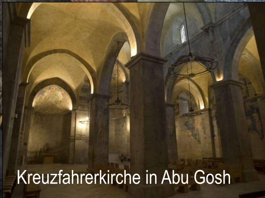
Kreuzfahrerkerche in Abu Gosh