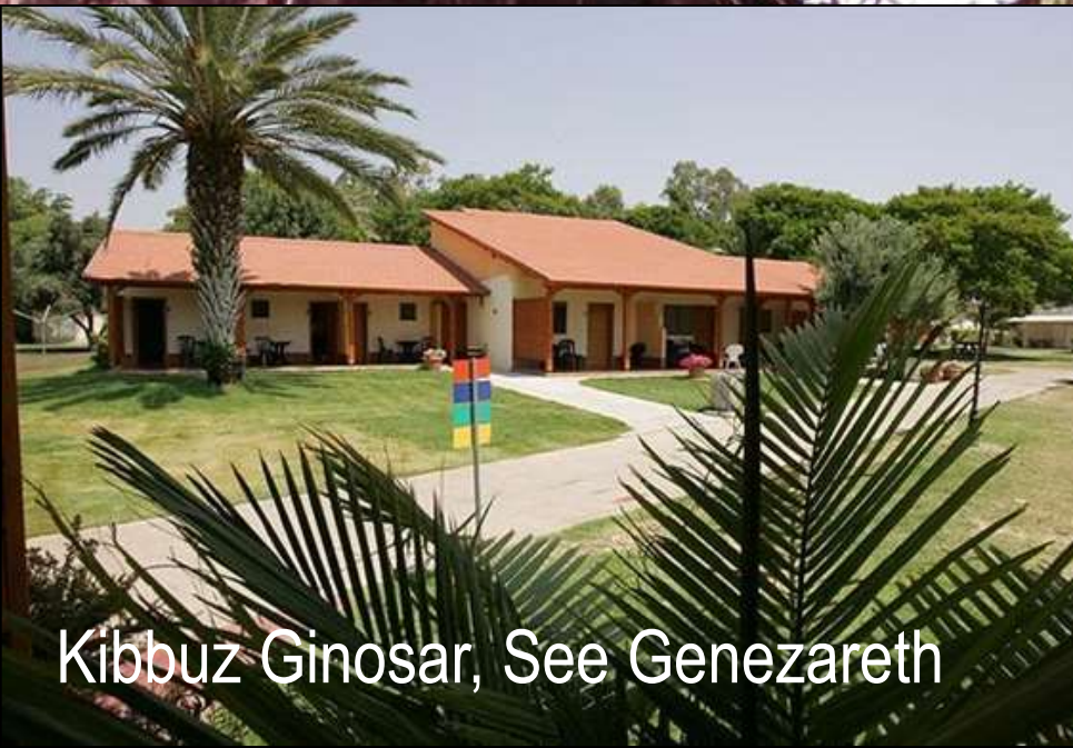
Kibbuz Ginosar, See Genezareth