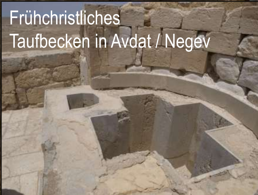
Frühchristliches Taufbecken in Avdat / Negev