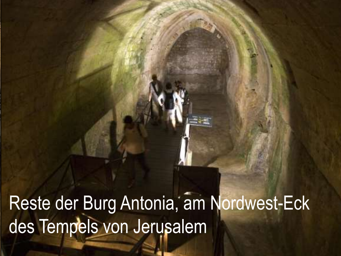
Reste der Burg Antonia, am Nordwest-Eck des Tempels von Jerusalem